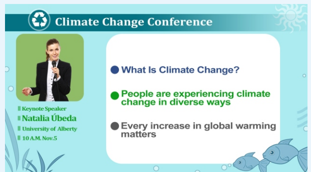
*自製版型:講者及課程資訊(遮罩應用)

* 場景版型可置換顏色底圖(黑白藍)或自製底圖 * 內建傳統 4:3 比例簡報版型(裁減黑邊) * 預設去背場景(置中、左右、子母) **依型號 * 遮罩支援解析度:1920*1080 (PNG)