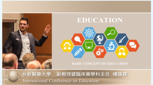
並排版型(講者左右裁切x簡報區x底圖)