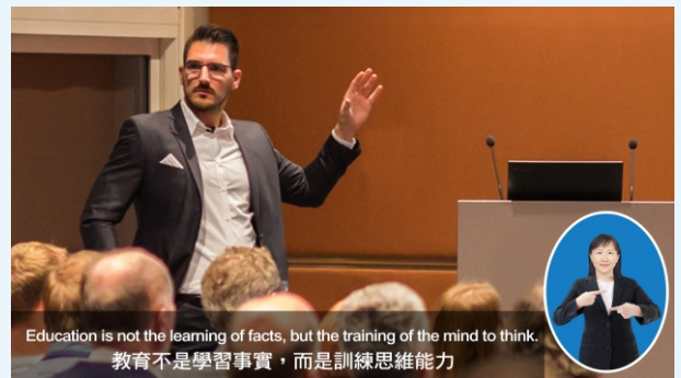
講師全畫面(中英字幕 x 右下遮罩)